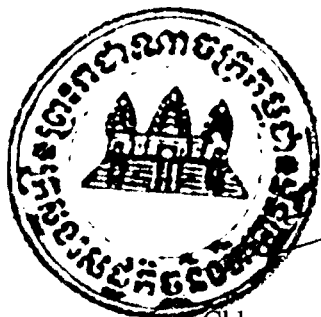
Keat Chhon Deputy Prime Minister Minister of Economy and Finance Acting on behalf of Royal Government of Cambodia

Please accept, Mr. Pham Lê Thanh, the assurances of my high consideration.